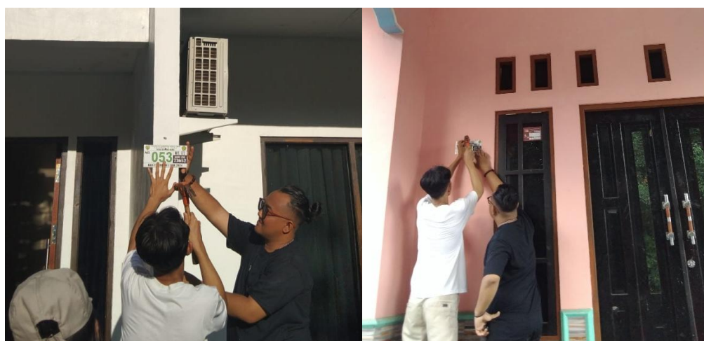
Gambar 2. Pemasangan plat penomoran rumah warga

Pertumbuhan penduduk yang pesat dan perkembangan teknologi informasi telah menjadikan nomor rumah sebagai salah satu elemen penting dalam kehidupan masyarakat. Nomor rumah tidak hanya berfungsi sebagai identitas suatu bangunan, tetapi juga memudahkan berbagai aktivitas sehari-hari, seperti pengiriman barang, layanan darurat, dan pengembangan infrastruktur digital. Sayangnya, masih banyak rumah yang belum dilengkapi dengan nomor rumah, sehingga menghambat upaya pemerintah dalam meningkatkan kualitas pelayanan publik dan kesejahteraan masyarakat (Fajri et al., 2024). Penomoran rumah merupakan upaya untuk meningkatkan kualitas hidup masyarakat dengan cara yang sederhana namun efektif. Dengan adanya nomor rumah, proses pencarian alamat menjadi lebih mudah dan efisien, baik bagi pemilik rumah sendiri maupun bagi pihak luar seperti petugas pos, kurir, atau petugas darurat. Nomor rumah juga memudahkan dalam proses pendataan penduduk dan pelaksanaan berbagai program pembangunan di tingkat lokal (Ramadhan, Firdaus, & Putri, 2024). Nomor rumah tidak hanya sekadar angka, tetapi juga merupakan identitas unik bagi setiap rumah. Keberadaan nomor rumah memperkuat rasa memiliki dan kebanggaan warga terhadap lingkungan tempat tinggalnya. Selain itu, nomor rumah juga mempermudah interaksi sosial antar warga, serta memfasilitasi kegiatan kemasyarakatan yang membutuhkan informasi alamat yang akurat (Patriadi, 2024).