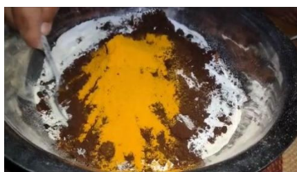
Gambar 1. Komposisi Lulur

Olahan kopi masih monoton untuk sekedar diseduh dan dibuat minuman, sehingga perlu adanya inovasi agar kopi Toraja yang memiliki inovasi produk yang begitu banyak seperti dapat dimanfaatkan menjadi produk olahan lain. Sehingga dapat menambah daya tarik minat seluruh kalangan pecinta kopi yaitu dibuat lulur dari bahan dasar kopi. Selain itu manfaat lainnya juga dapat meningkatkan UMKM masyarakat setempat sehingga peluang usaha masyarakat untuk menciptakan sebuah produk menjadi semakin luas. Kandungan zat yang terdapat dalam kopi berupa antioksidan dapat menghambat radikal bebas dari kulit dan berfungsi antioksidan ketika digunakan menjadikan kulit agar tetap kencang dan mencegah penuaan dini ketika lulur kopi digunakan secara teratur (Prasetyaningrum et al., 2019).