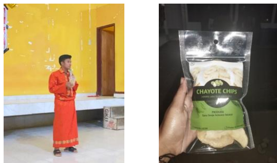
Gambar 2. Sosialisasi keripik labu siam

Tahap selanjutnya adalah sosialisasi serta pengenalan olahan labu siam menjadi keripik dan pengemasan yang baik kepada masyarakat di Sanggar Kegiatan Belajar Tana Toraja di kelurahan Rantekalua.