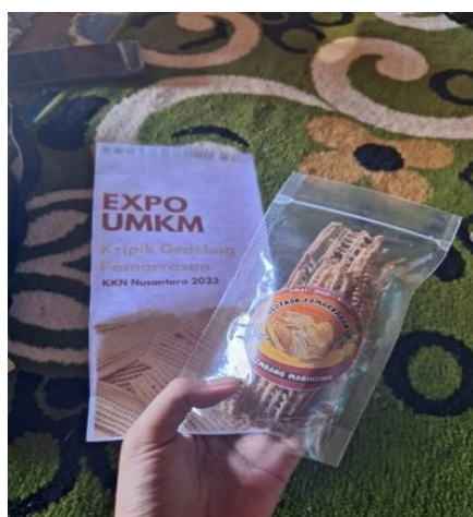
Gambar 2. Keripik Gedebog Pamarrasan

Pelepah pisang memiliki banyak kandungan manfaatnya, diantaranya dapat mengatur tekanan darah, sembuhkan anemia, membersihkan saluran kemih, dan obati diabetes. Adanya bentuk olahan pohon pisang ini diharapkan dapat membantu perekonomian serta mendukung produk UMKM Lembang Marinding (Nugroho, 2023).