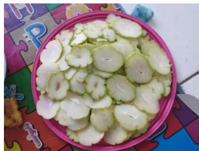
Gambar 1. Labu siam di tiriskan