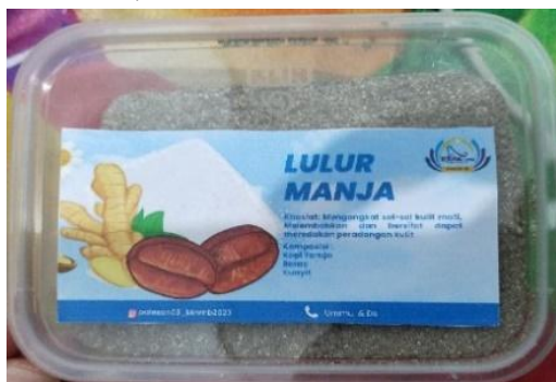
Gambar 2. Produk Kemasan Lulur Kopi

produk dari olahan potensi di daerah Tana Toraja supaya produk hasil olahan dapat semakin berkembang pesat (Permatasari et al., 2020).