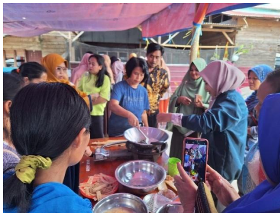
Gambar 1. Expo UMKM Gedebog Pamarrasan

Pamarrasan disini berperan sebagai rasa atau ciri khas dari Lembang Marinding karena di wilayah ini banyak ditemui pohon pamarrasan. Produk “Keripik Gedebog Pamarrasan” telah dipamerkan dalam kegiatan Expo UMKM dan dihadiri oleh semua kalangan masyarakat Lembang Marinding serta Camat Mengkendek.