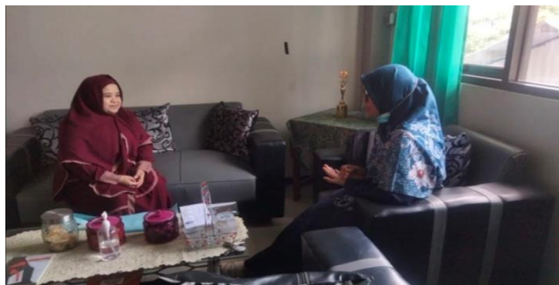
Gambar 1. Izin Pengabdian, dan Survei

Sebelum pelaksanaan kegiatan pelatihan dan pendampingan penulisan artikel ilmiah, tim meminta izin dan melakukan survei dengan membawa surat pengantar dan izin pengabdian yang ditunjukkan kepada kepala sekolah SMA Bayt Al Hikmah. Pada tahap ini, tim mendiskusikan banyak hal bersama kepala sekolah dan perwakilan guru untuk kemudian mendapatkan ide kegiatan yang perlu direncanakan untuk meningkatkan kualitas dan profesionalitas guru. Setelah melalui diskusi, tim mendapatkan ide untuk melaksanakan pelatihan penulisan artikel ilmiah berbasis best practice. Kegiatan ini sangat dibutuhkan untuk menunjang peningkatan karir guru mengingat masih minimnya karya tulis guru yang dipublikasikan. Tahapan ini dilakukan pada tanggal 18 Februari 2023 bertempat di SMA Bayt al Hikmah Pasuruan.