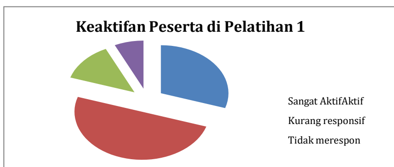
Gambar 2. Keaktifan Peserta di Pertemuan Pertama

Keberhasilan program ini diukur melalui proses maupun produk. Pertama, kesuksesan program secara proses dapat diukur dari a) partisipasi peserta saat pelatihan b) keaktifan dalam diskusi selama pelatihan, c) tanggapan yang diberikan oleh peserta pasca pelatihan, d) intensitas pendampingan, dan e) meningkatnya wawasan dan keterampilan peserta dalam penulisan artikel ilmiah. Pelaksanaan workshop dilakukan pada 10 Juni 2023 dan 17 Juni 2023 bertempat di gedung SMA Bayt Al Hikmah. Pelatihan berjalan selama 150 menit (2,5 jam) pada setiap pertemuan yang dimulai pada pukul 12.00-14.30 WIB. Ada dua puluh guru yang terlibat sebagai peserta pelatihan ini sehingga secara proses dapat diklaim telah sukses. Guru-guru nampak antusias mengikuti pelatihan. Tim juga melakukan observasi keaktifan peserta secara kualitatif melalui catatan lapangan. Hasilnya, hampir semua guru terlibat aktif saat diskusi dalam pelatihan pertama maupun kedua. Berikut ini adalah diagram keaktifan para guru dalam diskusi selama pelatihan pertama berlangsung.