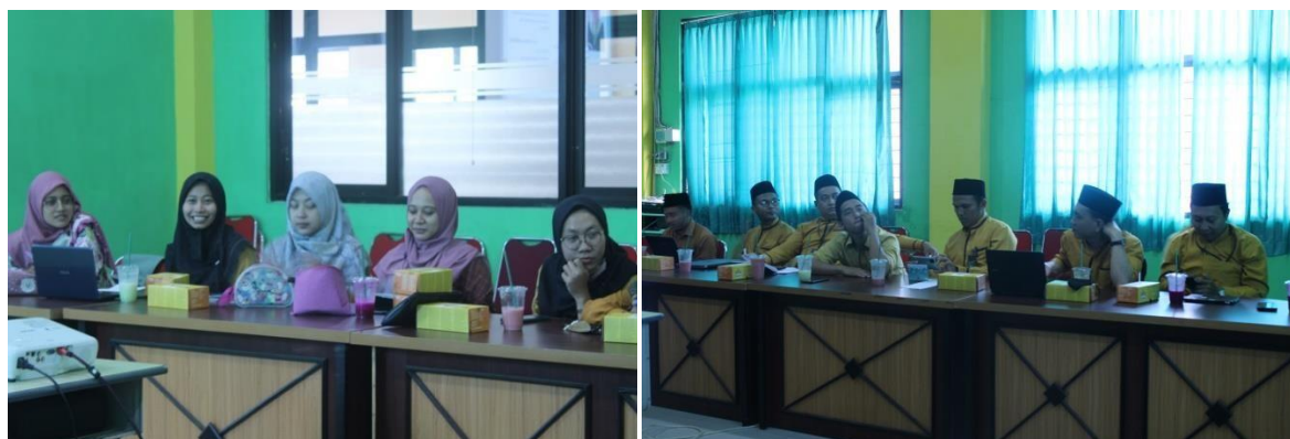
Gambar 4. Suasana Workshop

Sekalipun peserta dapat berpartisipasi secara aktif, tim tetap wajib menganalisis kebermanfaatannya dari pelatihan bagi para guru. Melalui wawancara pula, guru merasa senang karena dikenalkan dengan Turnitin, Paraphrase Tool, Google Translate dan Quilboot, Artificial Intellegence (AI) dan Google Scholar. Guru menyadari untuk menulis artikel tidak cukup bermodal ide cemerlang saja akan tetapi membutuhkan support teknologi sehingga penulisan artikel atau karya tulis lainnya dapat dilakukan dengan efektif dan efisien. Berikut adalah beberapa dokumentasi suasana saat pelatihan pertama berlangsung