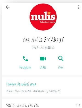
Gambar 6. Grup WA untuk Pendampingan Penulisan Artikel Best Practice

Tahap berikutnya yaitu pendampingan. Dalam melaksanakan pendampingan, tim membuat grup pada aplikasi Whasapp (WA). Berikut adalah tangkapan layar grup WA pendampingan penulisan artikel ilmiah.