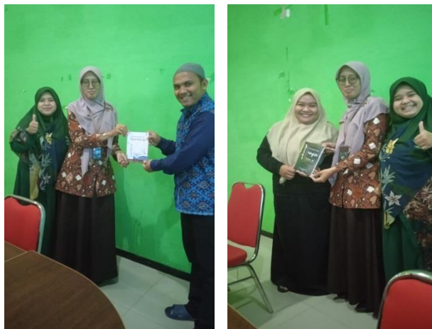
Gambar 5. Pemberian Hadiah Buku bagi Peserta Paling Interaktif selama Workshop

Tahap berikutnya yaitu pendampingan. Dalam melaksanakan pendampingan, tim membuat grup pada aplikasi Whasapp (WA). Berikut adalah tangkapan layar grup WA pendampingan penulisan artikel ilmiah.