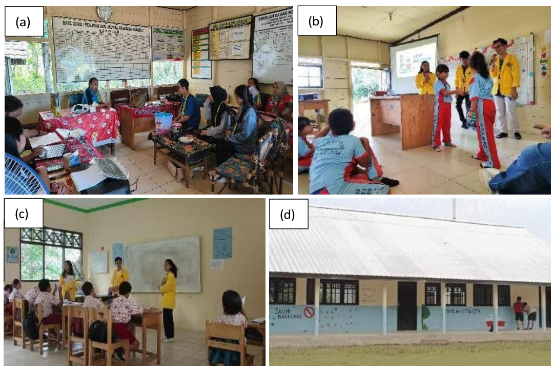
Gambar 2. (a) Survei potensi dan tantangan di sekolah (b) Kegiatan literasi anti bullying (c) Kegiatan pengajaran (d) Pelukisan dinding sekolah

Kegiatan KKN dimulai dengan survei SDN Kandris dan pertemuan di kantor guru bersama kepala sekolah beserta guru-guru SDN Kandris untuk membahas dan menyusun program kerja yang akan dilaksanakan selama masa KKN. Diskusi ini berfokus pada perencanaan dan implementasi program yang bertujuan untuk meningkatkan strategi dan inovasi budaya literasi di sekolah. Dalam diskusi ini, kepala sekolah memberikan arahan dan masukan untuk memastikan bahwa kegiatan yang dilakukan sesuai dengan kebutuhan dan prioritas SDN Kandris dalam hal meningkatkan strategi dan inovasi budaya literasi. Mahasiswa KKN dan pihak sekolah saling bertukar informasi dan menyusun rencana kerja yang efektif.