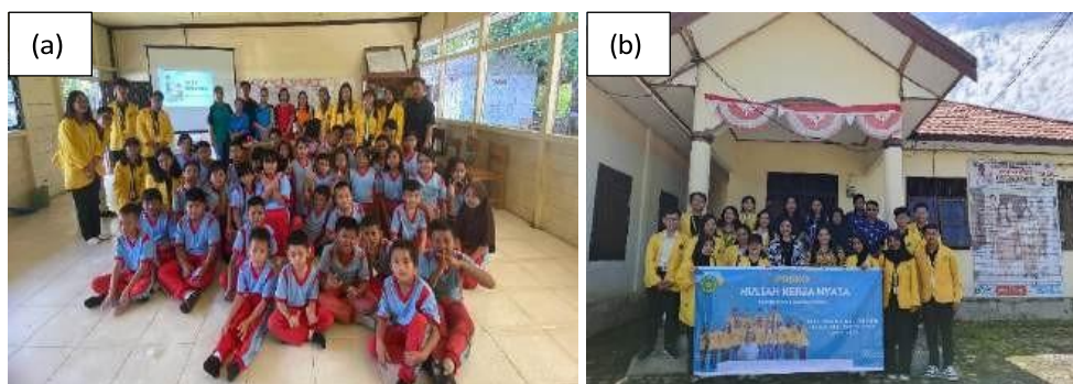
Gambar 3. (a)Foto bersama tim KKN dengan siswa dan guru di sekolah (b) Foto bersama perangkat desa dan dosen pembimbing lapangan

Selama melakukan KKN di Desa Kandris, Kecamatan Karusen Janang, Kabupaten Barito Timur tidak luput dari beberapa masalah dan tantangan. Namun demikian, dari permasalahan-permasalahan yang ada tidak membuat mahasiswa KKN merasa kecil hati dan terbebani dalam merealisasikan berbagai agenda kegiatan yang telah diprogramkan guna memotivasi semangat masyarakat dan sedikit memperbaiki kinerja Sumber Daya Manusia (SDM) di lingkungan lokasi kegiatan ini.