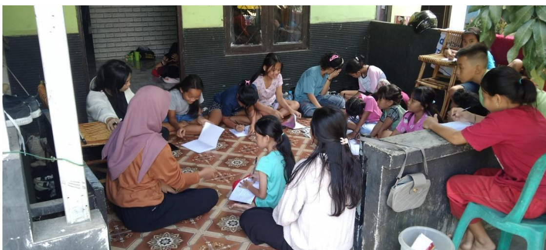
Gambar 1. Dokumentasi Kegiatan Bimbingan Belajar di posko KKN dan antusiasme anak-anak dalam mempelajari Bahasa Inggris.

Selama pelaksanaan program, mahasiswa KKN menyelenggarakan berbagai metode pembelajaran menarik yang dirancang untuk meningkatkan motivasi siswa. Aktivitas seperti permainan kata dan tebak-tebakan terbukti efektif dalam menarik minat siswa dan meningkatkan keterlibatan mereka. Berdasarkan pengamatan menunjukkan bahwa siswa menjadi lebih antusias dan aktif berpartisipasi selama sesi pembelajaran. Perubahan ini mengindikasikan bahwa metode pengajaran yang interaktif berhasil menciptakan suasana belajar yang lebih menarik dan menyenangkan yang berkontribusi pada peningkatan motivasi dan keterampilan bahasa Inggris siswa (Eli, 2021; Nodirabonu & Qizi, 2023).