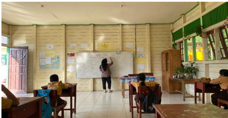
Gambar 2. Dokumentasi proses belajar mengajar mata pelajaran bahasa Inggris yang dilaksanakan di Sekolah Dasar Negeri 3 Tampa

Hasilnya menunjukkan bahwa terdapat peningkatan signifikan dalam motivasi siswa dan keterampilan bahasa Inggris setelah pelaksanaan atau penerapan program tersebut. Umpan balik dari siswa dan guru yang aktif menunjukkan bahwa siswa merasa lebih termotivasi untuk belajar dan menunjukkan kemajuan dalam kemampuan berbicara dan memahami bahasa Inggris. Namun meskipun ada kemajuan, beberapa siswa masih menghadapi tantangan dalam mencapai tingkat keterampilan yang lebih tinggi seperti komunikasi Bahasa Inggris secara aktif ( speaking ). Hal ini menunjukkan bahwa meskipun program ini berhasil, masih ada kebutuhan untuk pengembangan lebih lanjut dan dukungan berkelanjutan agar pencapaian akademik siswa dapat terus meningkat. Rekomendasi untuk keberlanjutan program ini meliputi pelaksanaan bimbingan belajar dengan menggunakan metode serupa secara terus-menerus, peningkatan akses ke media belajar, dan melibatkan komunitas sekolah baik guru maupun karyawan dalam mendukung proses pembelajaran. Evaluasi berkala harus konsisten dilakukan dan penyesuaian program berdasarkan umpan balik siswa dan guru juga sangat penting untuk memastikan efektivitas jangka panjang dan adaptasi terhadap kebutuhan pendidikan yang terus berkembang.