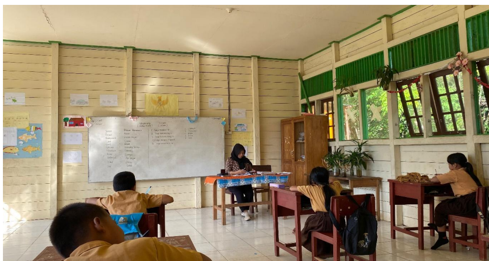
Gambar 3. Dokumentasi kegiatan belajar mengajar mata pelajaran Bahasa Inggris di Sekolah Dasar Negeri 3 Tampa.

Hasilnya menunjukkan bahwa terdapat peningkatan signifikan dalam motivasi siswa dan keterampilan bahasa Inggris setelah pelaksanaan atau penerapan program tersebut. Umpan balik dari siswa dan guru yang aktif menunjukkan bahwa siswa merasa lebih termotivasi untuk belajar dan menunjukkan kemajuan dalam kemampuan berbicara dan memahami bahasa Inggris. Namun meskipun ada kemajuan, beberapa siswa masih menghadapi tantangan dalam mencapai tingkat keterampilan yang lebih tinggi seperti komunikasi Bahasa Inggris secara aktif ( speaking ). Hal ini menunjukkan bahwa meskipun program ini berhasil, masih ada kebutuhan untuk pengembangan lebih lanjut dan dukungan berkelanjutan agar pencapaian akademik siswa dapat terus meningkat. Rekomendasi untuk keberlanjutan program ini meliputi pelaksanaan bimbingan belajar dengan menggunakan metode serupa secara terus-menerus, peningkatan akses ke media belajar, dan melibatkan komunitas sekolah baik guru maupun karyawan dalam mendukung proses pembelajaran. Evaluasi berkala harus konsisten dilakukan dan penyesuaian program berdasarkan umpan balik siswa dan guru juga sangat penting untuk memastikan efektivitas jangka panjang dan adaptasi terhadap kebutuhan pendidikan yang terus berkembang.