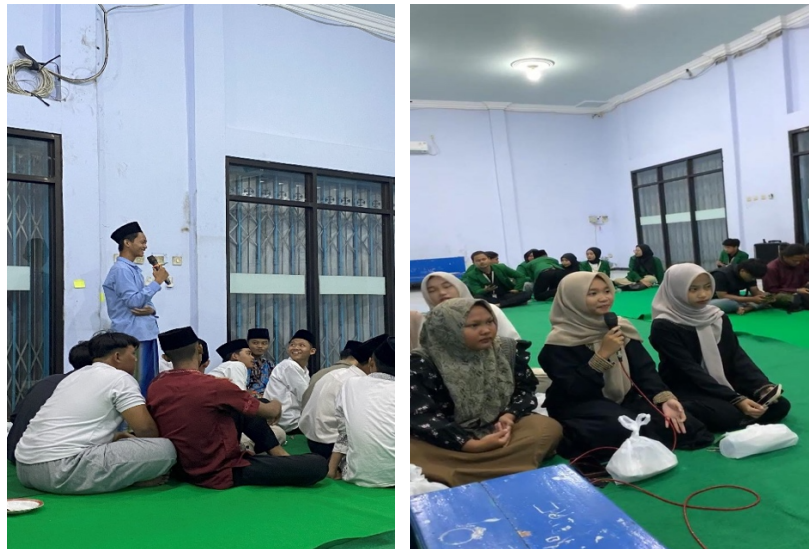
Gambar 1.1 Sesi Diskusi