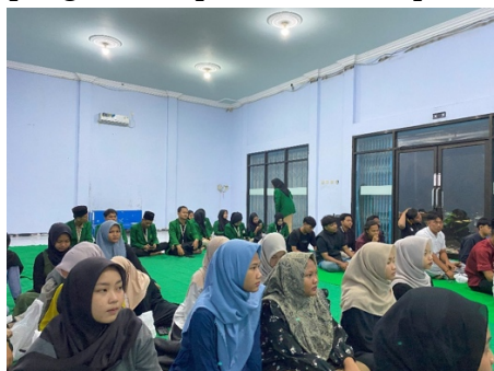
Gambar 1.3 Para remaja antusias mendengarkan materi

Pada tahap transformasi menjadi momen penting dalam merealisasikan seluruh proses yang telah dirancang sebelumnya. Kegiatan edukasi digital yang dilaksanakan di BUMDes Sitimerto dan mendapat antusiasme tinggi dari kalangan remaja. Kegiatan diawali dengan pengantar mengenai pentingnya memahami perilaku digital, dilanjutkan dengan pemaparan materi, diskusi kasus nyata, hingga simulasi interaktif. Peserta mengikuti kegiatan dengan penuh semangat dan menunjukkan ketertarikan tinggi, terutama saat sesi berbagi pengalaman dan diskusi terbuka. Mereka tidak hanya menjadi pendengar, tetapi juga aktif berbagi pandangan dan pengalaman pribadi terkait perundungan di dunia maya.