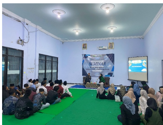
Gambar 1.2 Penyampaian materi

Pada tahap proses perancangan program dilakukan dengan menggabungkan temuan dari tahap sebelumnya yaitu discovery dan dream , kemudian dikembangkan menjadi bentuk kegiatan yang nyata dan dapat dilaksanakan secara langsung (Saragih et al., 2025). Dalam merancang kegiatan edukasi digital, mahasiswa bekerja sama dengan tokoh pemuda desa dan mahasiswa mengundang pemateri yang memiliki kemampuan untuk memberikan sosialisasi terkait program edukasi digital. Materi yang dikembangkan mencakup berbagai topik penting, antara lain pengenalan konsep cyberbullying , jenis-jenis perundungan digital, dampaknya terhadap kesehatan mental, cyberbullying dalam Undang-Undang ITE, pengertian hoax dan hukum hoax dalam Undang-Undang, pengertian framing media dan dampaknya, bijak bermedia sosial dan pentingnya etika dalam berkomentar, serta strategi menghadapi dan melaporkan kasus perundungan di media sosial.